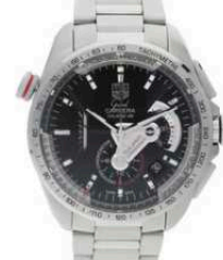
TAG Heuer Grand C... CAV5115.BA0902 8.700 €