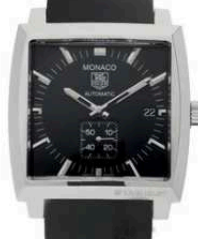
TAG Heuer Monaco WW2110.FT6005