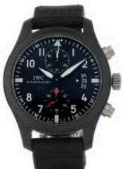
IWC Pilots Chronogr... IW388001 11.800 €