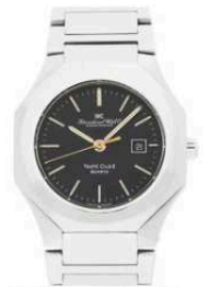
IWC Yacht Club II 3012