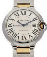
Cartier Ballon Bleu W6920047 3284 8.300 €