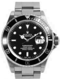
Rolex Submariner 16610