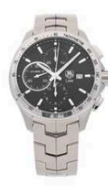
TAG Heuer Link CAT2010.BA0952 2.005 €