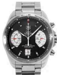
TAG Heuer Grand C... CAV511A.BA0902 7.200 €