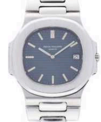
Patek Philippe Naut... 3700