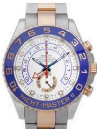
Rolex Yacht-Master II 116681 22.900 €