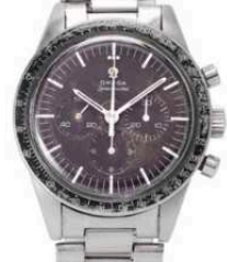
Omega Speedmast... ST 105.003-65