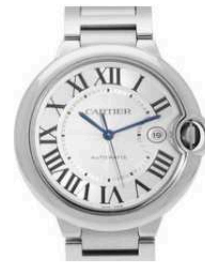
Cartier Ballon Bleu W69012Z4 3001/3765 6.350 €