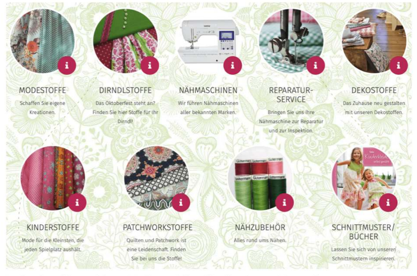
Stoffe, Nähmaschinen, Zubehör: Bei Stoffe Egert fühlen sich Nähbegeisterte wie im Paradies

Das traditionsreiche <u>Stoffgeschäft</u> in der Brucker Innenstadt ist ein wahres Nähparadies für alle Nähbegeisterten. Denn hier finden sie alles, was für das nächste Nähprojekt gebraucht wird: Eine riesige Auswahl an Mode- und Dekostoffen inklusive der aktuellen Burda-Kollektionen. Dazu Kurzwaren, Nähutensilien und alles denkbare Nähzubehör. Im Obergeschoss des 200 qm großen Geschäfts befindet sich das deutschlandweit bekannte Dirndl-Studio mit ausgewählten und edlen Dirndl-Stoffen und -Accessoires – eine beliebte Anlaufstelle für fast alle Schülerinnen der Dirndl-Nähschülerinnen im Großraum München.