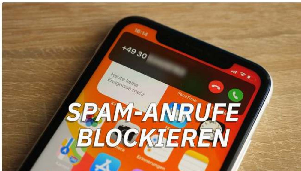
Spam-Anrufe blockieren – So geht's bei iOS und Android