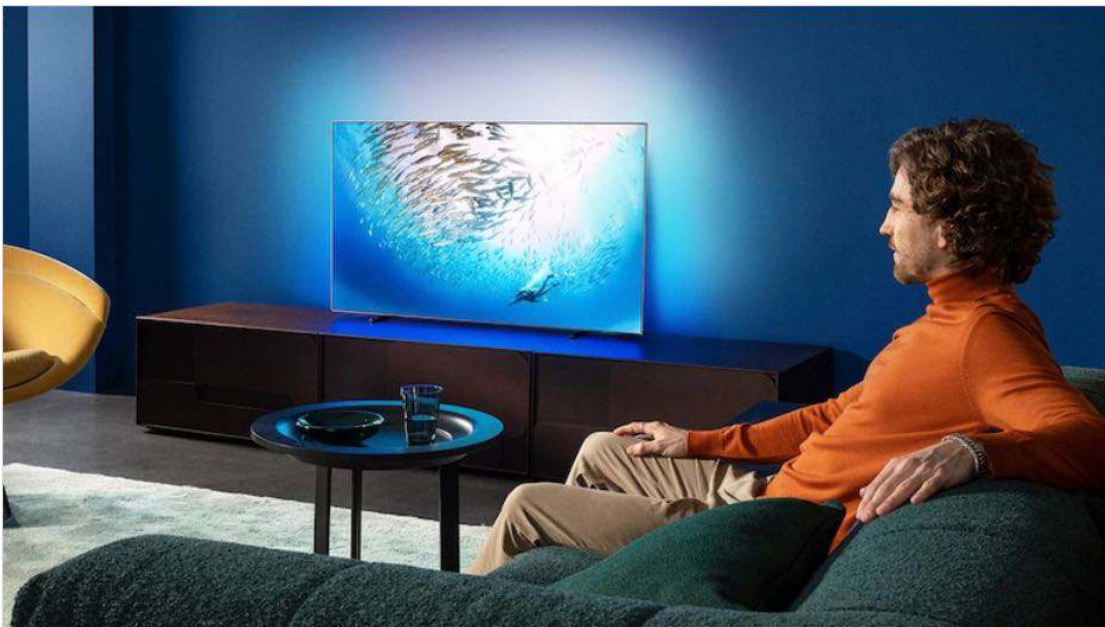
Philips 55OLED805 mit Ambilight.

Als besonderen Anreiz verlosen wir unter allen Teilnehmern der Umfrage einen attraktiven Gewinn: den Fernseher Philips 55OLED805 im Wert von rund 1.700 Euro. Das 55-Zoll-Gerät arbeitet mit OLED- sowie der philipseigenen Ambilight-Technologie und zaubert damit hochklassige Fernsehbilder in Ihr Wohnzimmer, deren Qualität nur von wenigen Testkandidaten unserer Fernseher-Bestenliste übertroffen wird. Dazu kommen zahlreiche Schnittstellen, ein ausgezeichnetes Soundsystem und das funktionsreiche SmartTV auf Android-Basis.