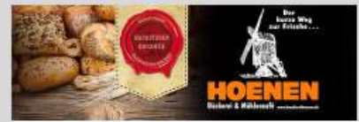
Hoenen Bäckerei & Mühlencafé