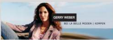
la belle Moden