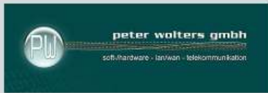
Peter Wolters GmbH