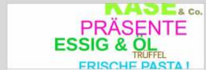
Kempener Früchte- und Feinkosthaus