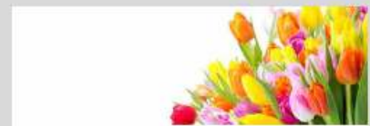
Land Liebe - Die Floristen