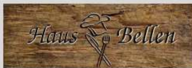
Landgasthof Haus Bellen