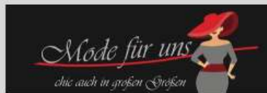
Mode für uns