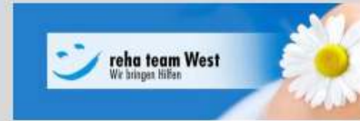
reha team West