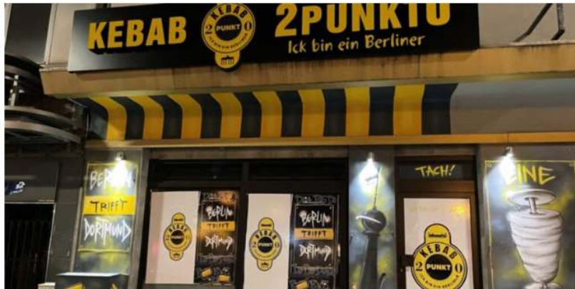
Der Dortmunder Dönerladen Kebab2punkt0 veranstaltet ein kurioses Gewinnspiel.

Haben Sie schon einmal daran gedacht, ein Jahr lang täglich einen Döner zu essen? Wahrscheinlich nicht, aber eine Dortmunder Dönerbude will genau das nun möglich machen und verlost fürs kommende Jahr eine Döner-Flatrate.