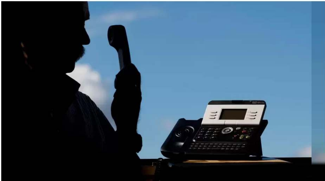
Die Polizei warnt vor Gewinnspiel-Betrügereien via Telefon.

Veröffentlicht: 15.05.2022, 13:39 Uhr Ort: Deggenhausertal