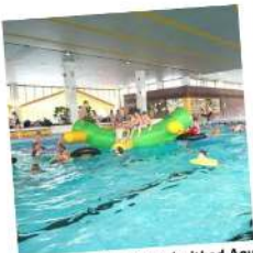
100 x Freikarten für das Freizeitbad Aquarell