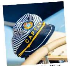
1x Co-Käpt'n auf der Möwe