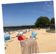
100 x Freikarten für das Seebad