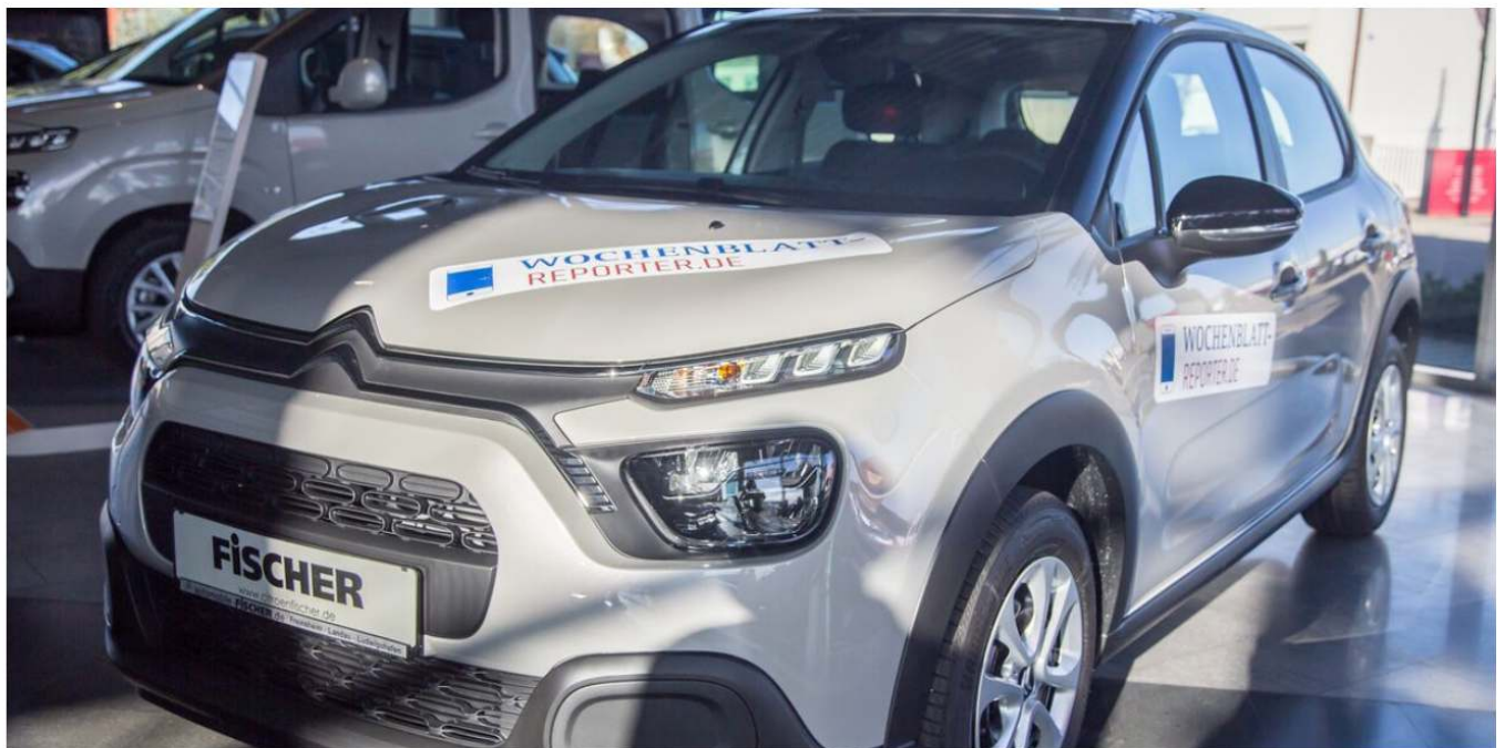
Dieser neue Citroën C3 winkt als Preis im großen Wochenblatt-Weihnachtspreisrätsel.

Weihnachtspreisrätsel. Es gehört dazu wie der Adventskranz mit seinen vier Kerzen und der Adventskalender mit seinen 24 Türchen: Alle Jahre wieder freuen sich unsere Leserinnen und Leser in der Vorweihnachtszeit auf unser beliebtes Weihnachtspreisrätsel. So auch in diesem Jahr, wenn sich das Wochenblatt in Weihnachtstimmung begibt und wieder ein nagelneues Auto verlost. Rätseln Sie mit und mit etwas Glück machen Sie sich selbst noch vor Weihnachten ein wunderbares Geschenk.