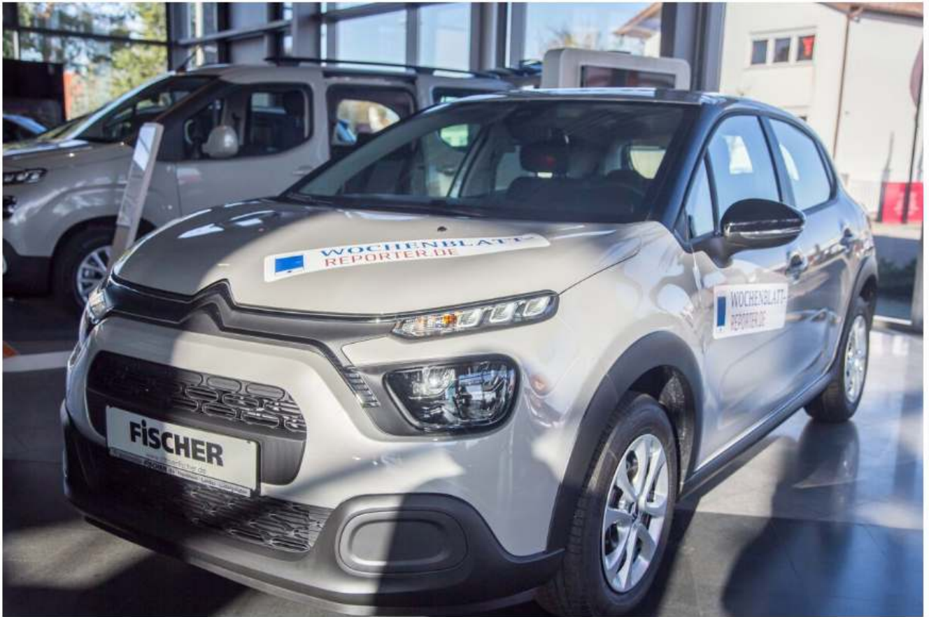
Dieser neue Citroën C3 winkt als Preis im großen Wochenblatt-Weihnachtspreisrätsel.

Unter allen Teilnehmenden des Weihnachtsrätsels, die das richtige Lösungswort ausgewählt haben, wird am 16. Dezember als Preis ein neues Auto verlost: ein Citroën C3 PureTech 82 You im Wert von 16.180 Euro, bereitgestellt vom Autohaus Fischer in Freinsheim, zu dem auch die Zweigstellen in Landau und Ludwigshafen gehören. Das Glückslos zieht die Pfälzische Weinkönigin Lea Baßler.