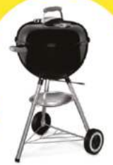
Weber Classic Kettle – Holzkohlegrill Ø 47 cm Farbe: Schwarz