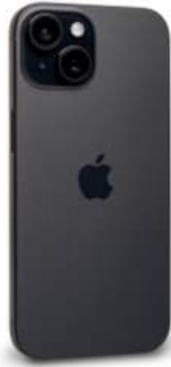
iPhone 15 – 6,1" Display