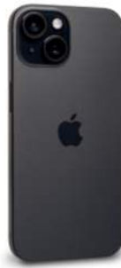
iPhone 15 – 6,1" Display