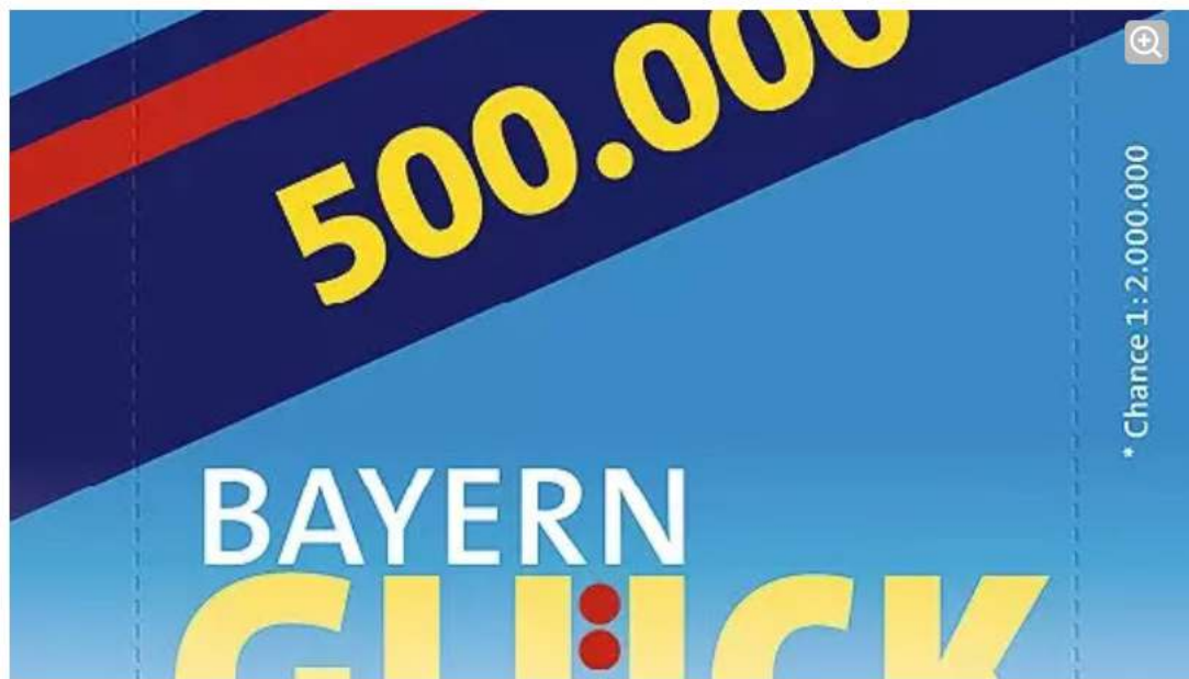
BayernGLÜCK: Großformat, 500.000 Euro Hauptgewinn.

Diesen besonderen Weihnachtscountdown voller Chancen gibt es aber auch zu gewinnen: bei der "Genau mein Adventskalender!" Aktion von LOTTO BAYERN und der Abendzeitung München. Insgesamt verlosen wir 72 Adventskalender – bestückt mit Ihren Lieblingslosen von LOTTO Bayern!