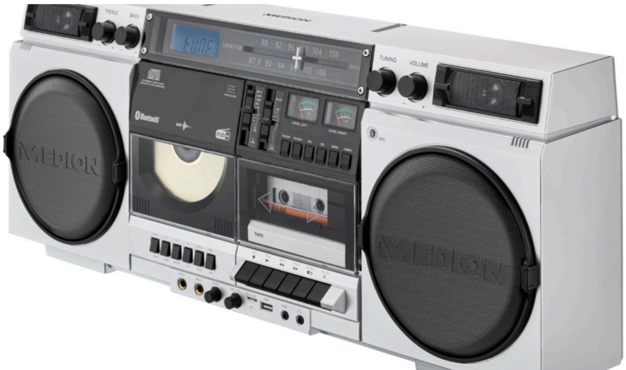
MEDION 80s Retro Boombox