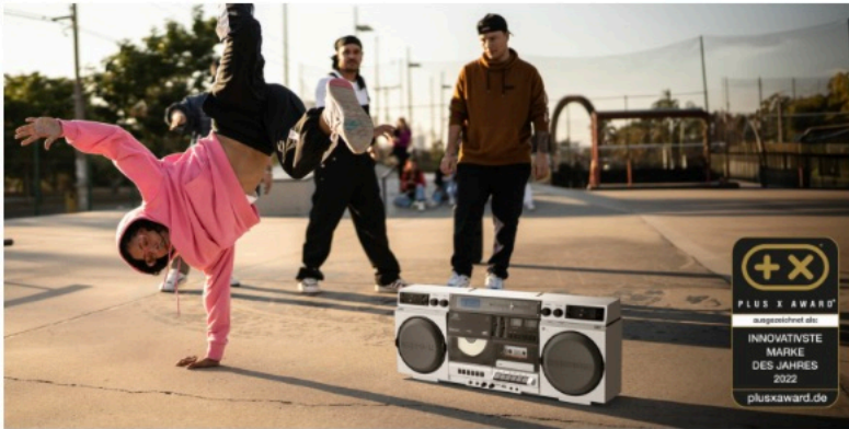
MEDION 80s Retro Boombox MEDION