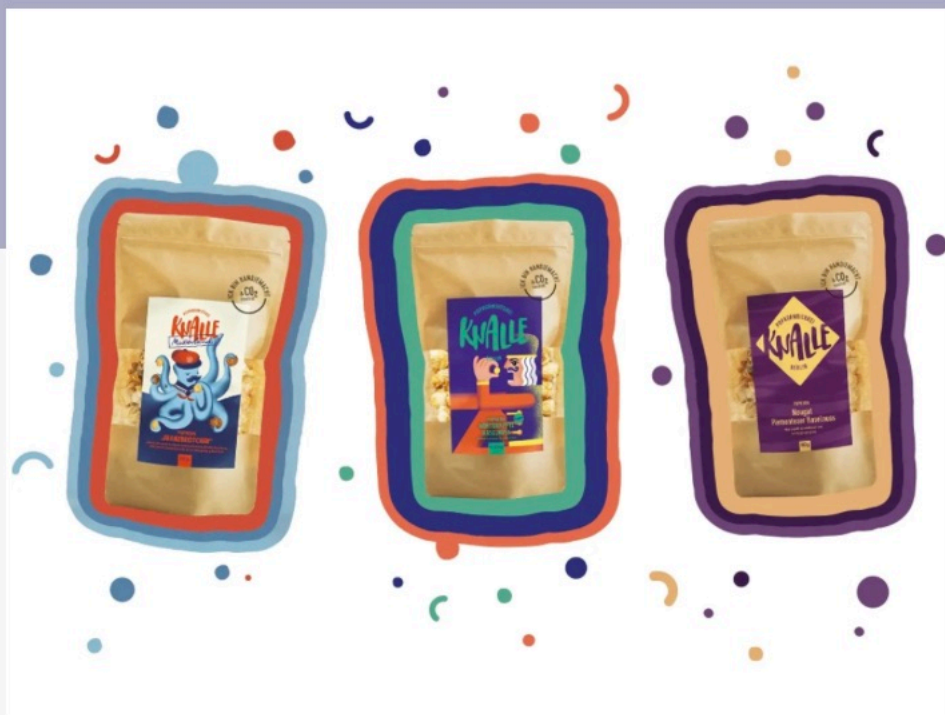
Illustration: Julia Hecht

2024 wird lecker – wenn Sie diese Woche bei unserem Gewinnspiel Glück haben: Wir verlosen ein Jahresabo der Berliner Popkornditorei Knalle, die Popkorn in den Sorten Butterkaramell, Winterapfel oder Franzbrötchen herstellt.