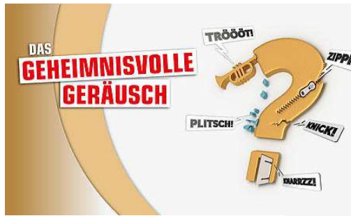
Das geheimnisvolle Geräusch