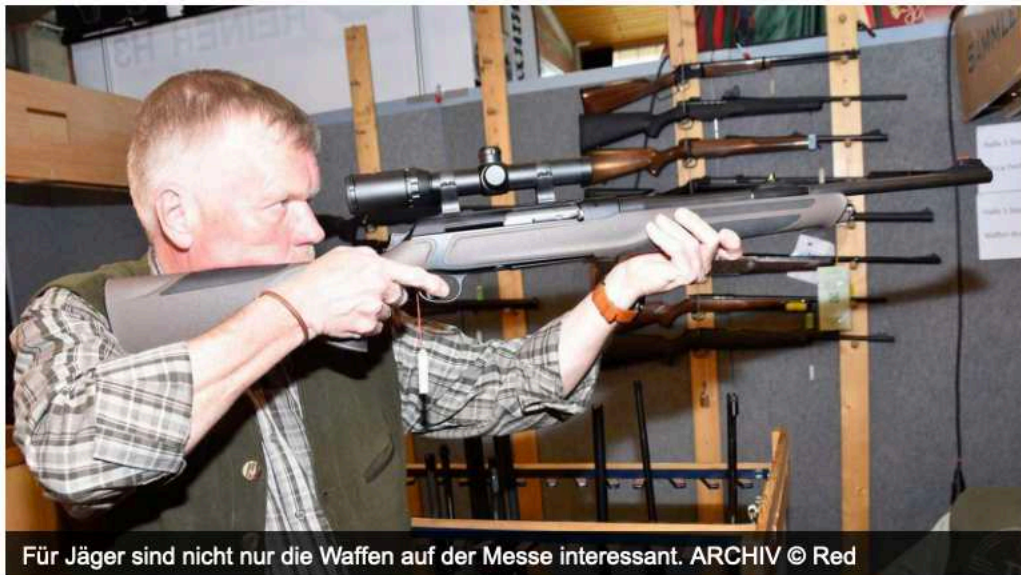
Für Jäger sind nicht nur die Waffen auf der Messe interessant.

Alsfeld (cdc). Sie ist einzigartig in Hessen und geht vom 8. bis zum 10. März bereits in ihre 21. Auflage, die Messe »Jagen, Fischen, Offroad« in der Alsfelder Hessenhalle. Sie ist täglich von 9.30 bis 17 Uhr geöffnet.