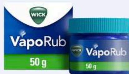
WICK VapoRub Erkältungssalbe 50 g