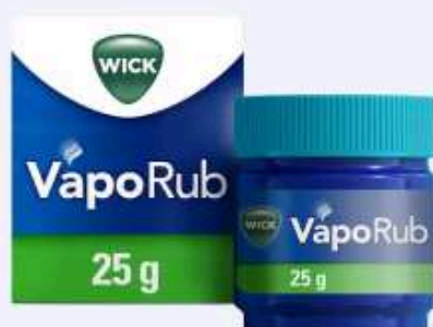
WICK VapoRub Erkältungssalbe 25 g