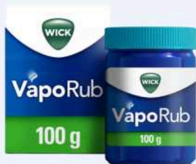
WICK VapoRub Erkältungssalbe 100 g

Welches Aktionsprodukt möchten Sie einlösen? Bitte wählen Sie nur das Produkt aus, das auch auf Ihrem Kaufbeleg gelistet ist.