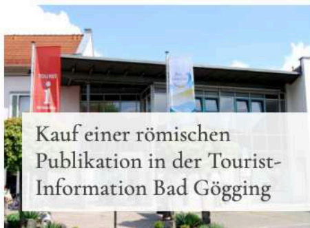
Kauf einer römischen Publikation in der Tourist-Information Bad Gögging