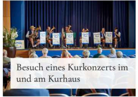
Besuch eines Kurkonzerts im und am Kurhaus