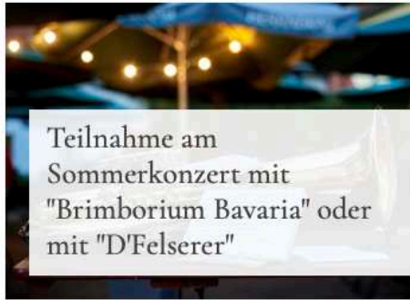
Teilnahme am Sommerkonzert mit "Brimborium Bavaria" oder mit "D'Felserer"