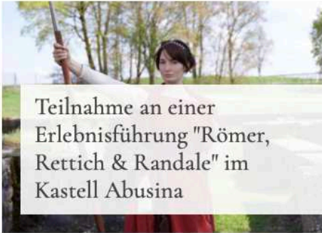
Teilnahme an einer Erlebnisleitung "Römer, Rettich & Randle" im Kastell Abusina