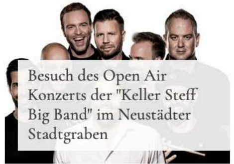
Besuch des Open Air Konzerts der "Keller Steff Big Band" im Neustädter Stadtgraben