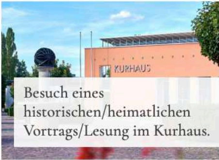
Besuch eines historischen/heimatlichen Vortrags/Lesung im Kurhaus.