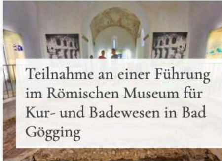
Teilnahme an einer Führung im Römischen Museum für Kur- und Badewesen in Bad Gögging