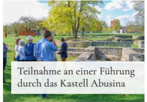
Teilnahme an einer Führung durch das Kastell Abusina