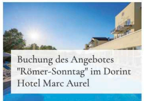
Buchung des Angebotes "Römer-Sonntag" im Dorint Hotel Marc Aurel