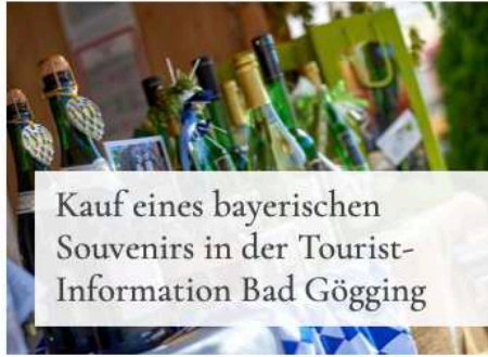
Kauf eines bayerischen Souvenirs in der Tourist-Information Bad Gögging