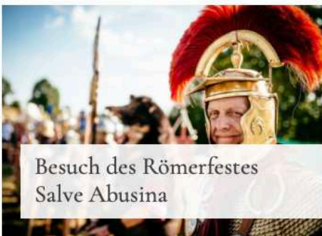
Besuch des Römerfestes Salve Abusina