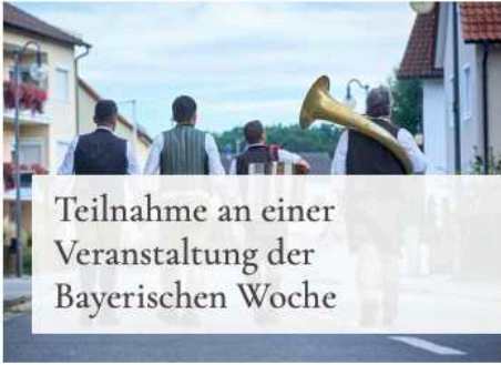
Teilnahme an einer Veranstaltung der Bayerischen Woche